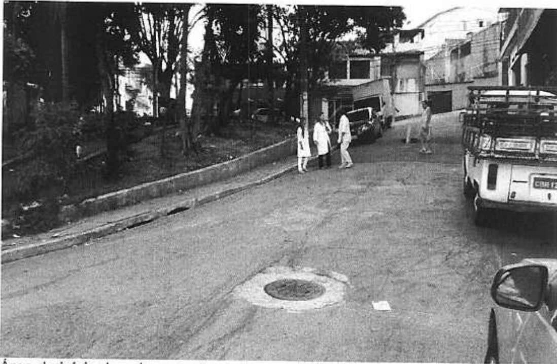
Área de início de solapamento e presença de tampa da Sabesp.